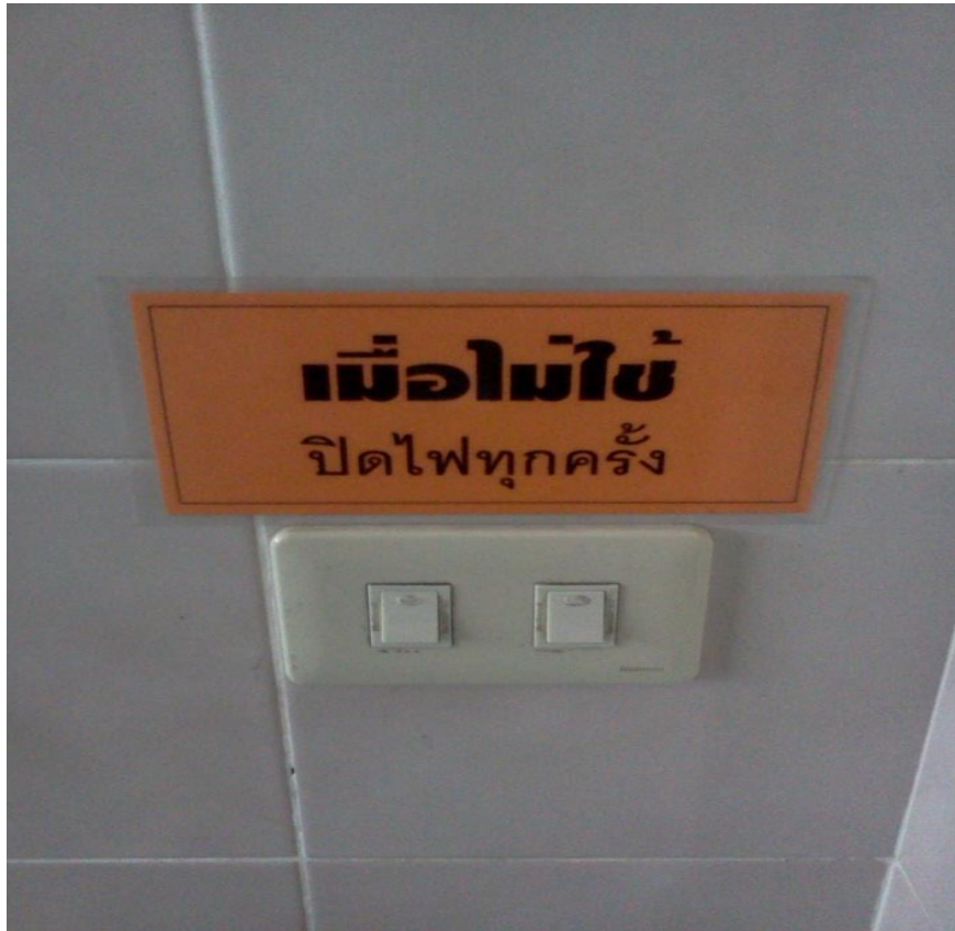
รณรงค์การปิดไฟหลังเลิกใช้งาน